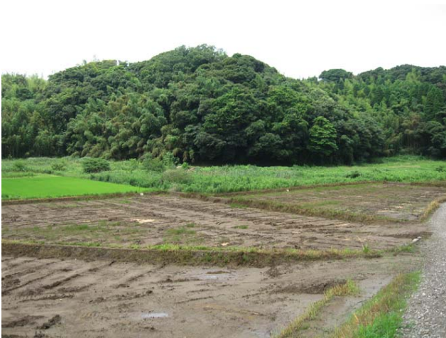
耕作放棄地の整備状況（下半分）