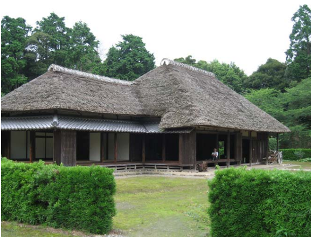
大原幽学記念館に隣接の旧林家住宅