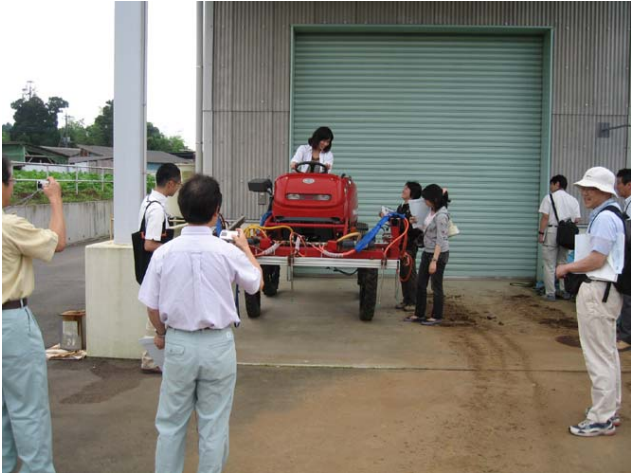
液肥散布機に乗るメンバー