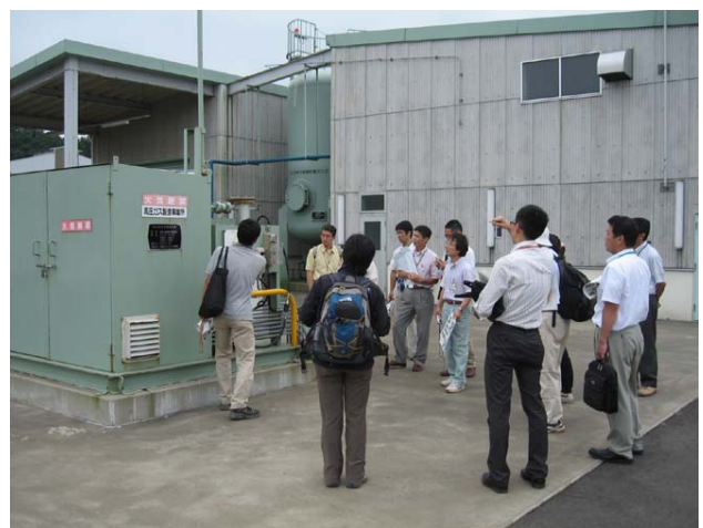
メタンガスの燃料利用の説明を聞くメンバー