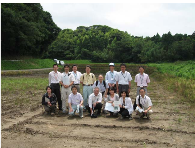
整備された畑（元耕作放棄水田）の中にて