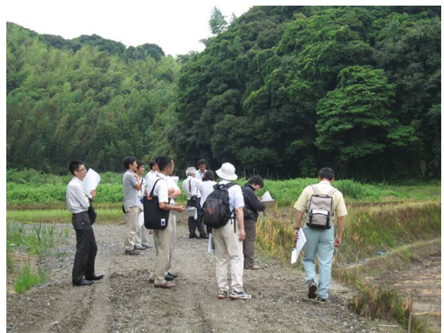
整備方法の説明を聞くメンバー