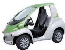
トヨタ車体コムス