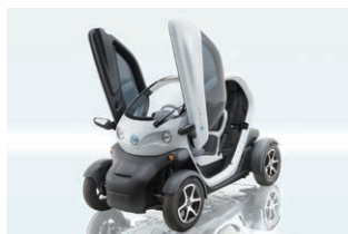
日産ニューモビリティコンセプト