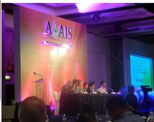
図 1 バイオマス TF 活動の様子(左)、アジア・オセアニア藻類サミットへの参加(右)