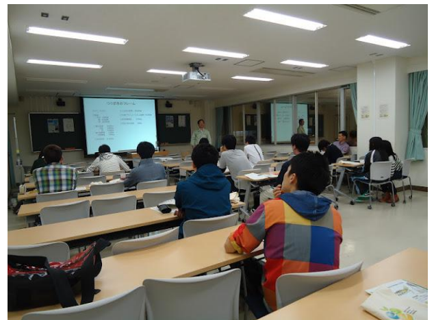
図 第 17 回 3E カフェ ポスターと、講演形式の第 17 回カフェの様子