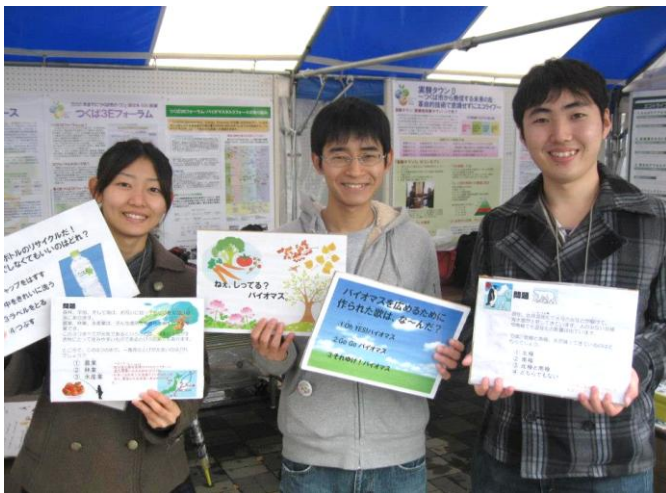
図 2 つくばサイエンスコラボでのクイズ・ミニ講座の実施

11月17,18日に開催されたつくばサイエンスコラボに出展し、小学生～中学生・親子連れの方を対象に、環境と科学についてのクイズと、つくば市の環境へ取り組みについてのミニ講座を行った。あいにくの雨であったが、親子連れの方に好評で、環境について積極的に学んでもらうことができた。